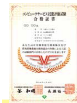
合格者には合格証書を授与するとともに「技士」の称号が与えられます。

入門者からエキスパートを対象にしたグレード設定(上位から1級→2級→3級)がされており、実務作業に直結した試験内容になっておりますので、個人スキルを的確に評価できるものになっています。